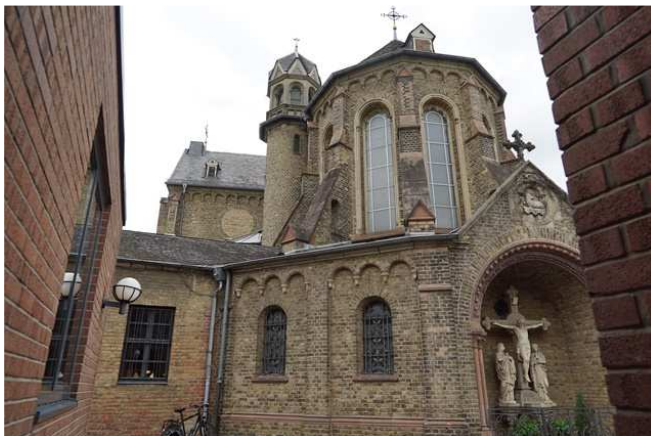
Blick aus dem Eingang des „Treffpunktes“. Sehr beschützt und behütet, aber abgekoppelt von der Öffentlichkeit.