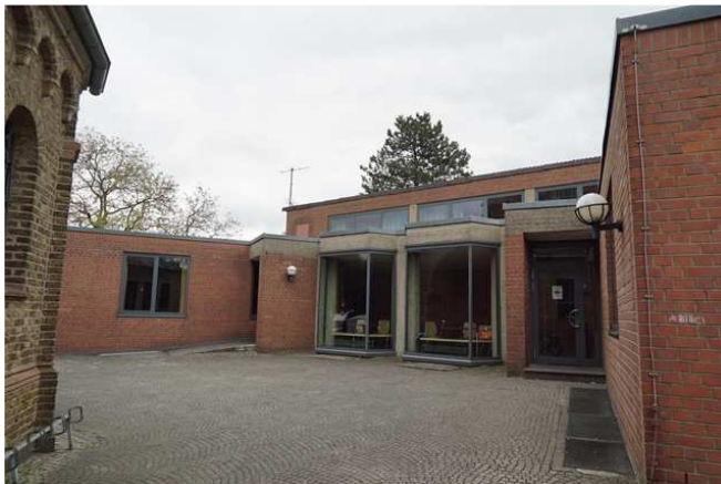
Das Leben der Gemeinde ist nach außen nicht sichtbar und einladend.