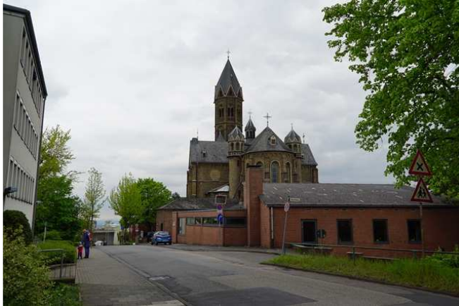
Zufahrt zu Gemeindezentrum und Kirche vom Schloss kommend.