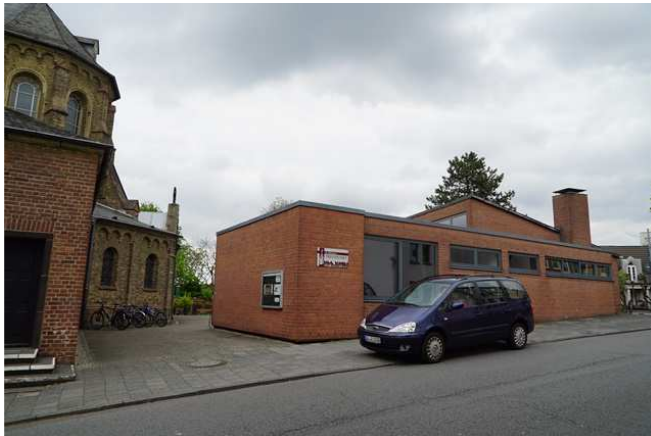
Blick auf das Gemeindezentrum „Treffpunkt“ mit weitgehend geschlossener Ziegelsteinfassade und engem Zugang.